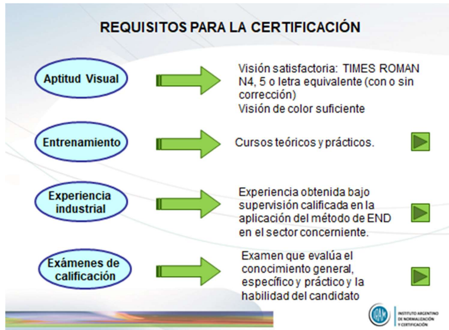
Figura 3: requisitos para la certificación según NM ISO 9712

Existe un entrenamiento mínimo en horas que exige la norma, como ejemplo para una persona que desee calificarse en PM2 requiere 40 hs. y en US2 requiere 120 hs.; todos los detalles de las características de los entrenamientos para todos los métodos y niveles pueden encontrarse en el “syllabus” del OIEA: IAEA-TECDOC 628/Rev.3 [3].