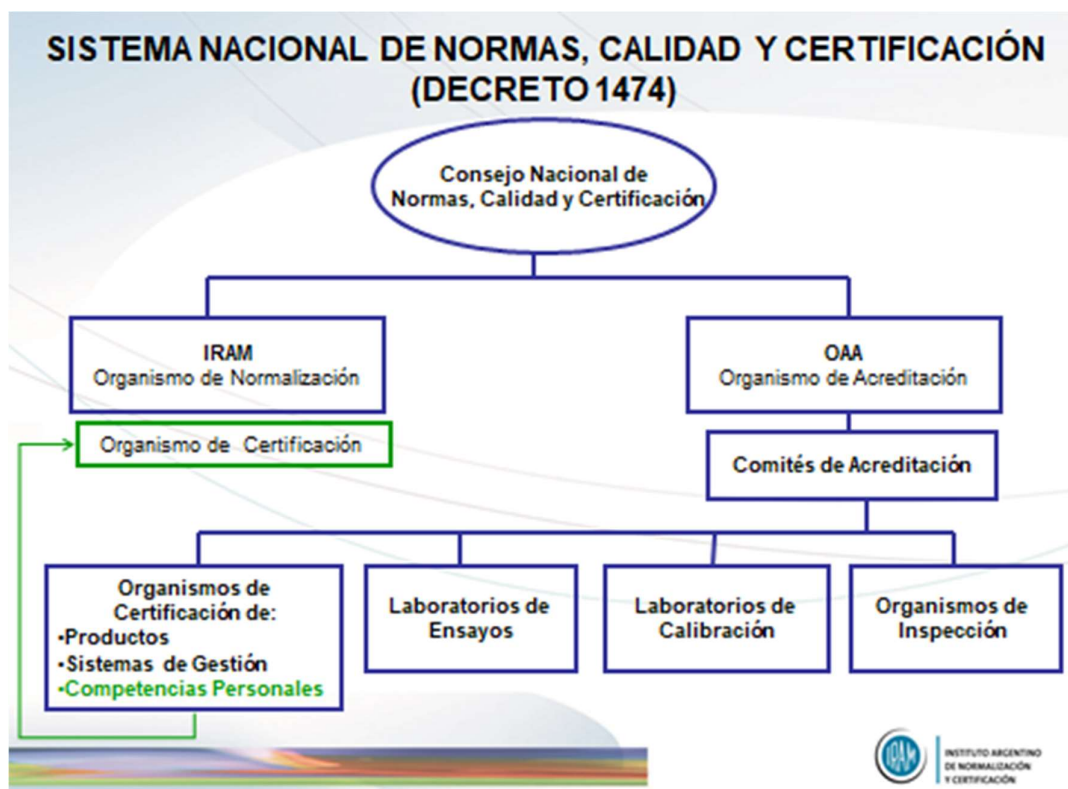
Figura 1: Sistema Nacional

En la Figura 2., se indica que cualquiera que sea el sistema de competencias que se desee certificar, deberá ser sometido al criterio de la norma IRAM ISO/IEC 17024[1], que es la que vela para que el sistema de certificación cumpla con cada uno de los requerimientos de la norma específica en la certifique la competencia, en este caso la norma IRAM NM ISO 9712 [2], en un marco de total transparencia.